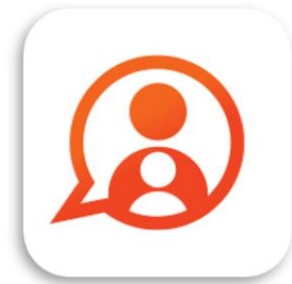
Konnnect OuderApp Konnnect B.V.

Gegevens niet ontvangen? Neem dan contact op met de kinderopvangorganisatie, zij kunnen nieuwe gegevens sturen.